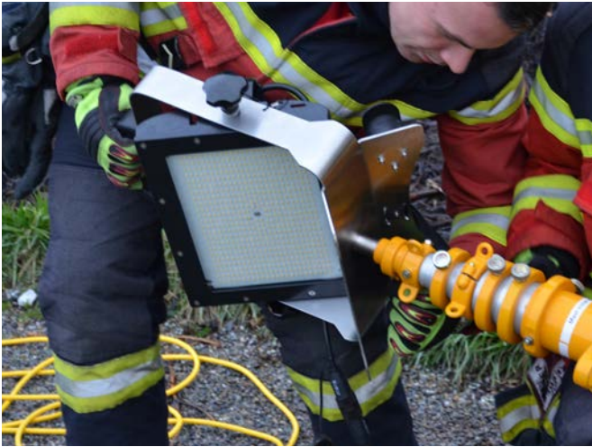
Anwendung auf Stativ