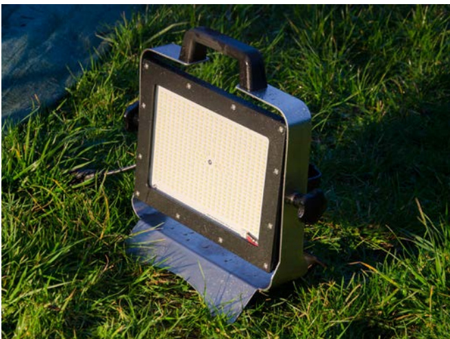
Die AlphaLUXX Mobil ist robust und wetterfest