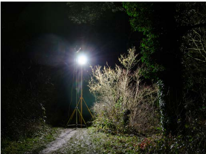
Ausleuchtung mit AlphaLUXX Army auf Stativ