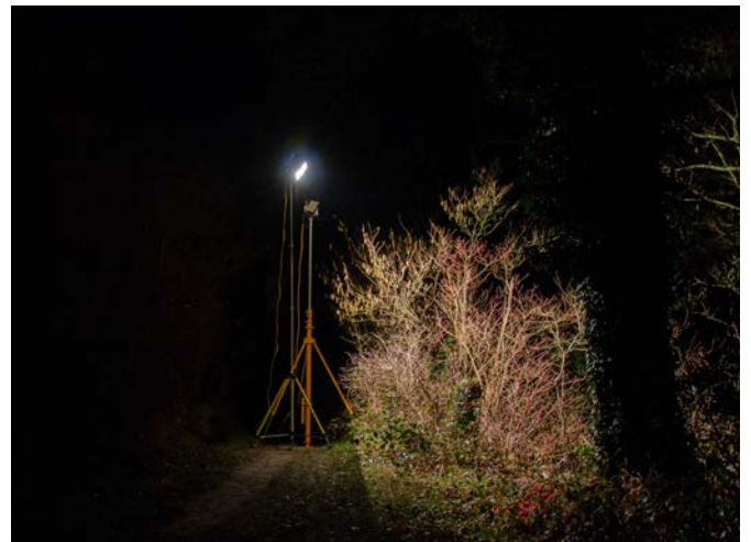
Ausleuchtung mit Halogenstrahler auf Stativ