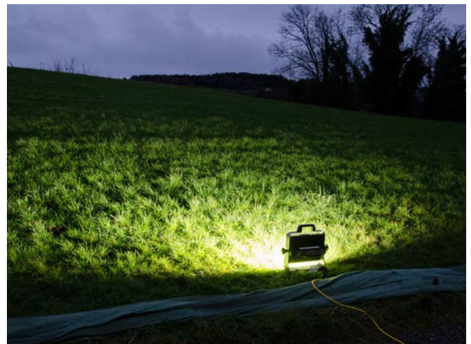
AlphaLUXX Mobil mit Bodenständer einfach in der Wiese platziert