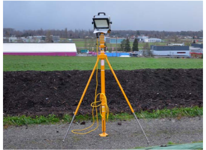
Vergleich AlphaLUXX mit Halogenstrahler 1'000 W