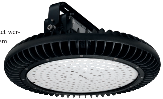
Bild 3: Neben den Kühlrippen sorgt auch eine spezielle Oberflächenbeschichtung für die Ableitung der entstehenden Wärme

Zusätzlich gefördert wird dieses durch den Einsatz einer schmutzabweisenden und dünnen PTFE-Oberflächenbeschichtung. Selbst bei anspruchsvollen Arbeitsumgebungen mit hoher Schmutz- und Staubbelastung wird hiermit für die Ableitung der gesamten entstandenen Wärme gesorgt und eine Lebensdauer der Leuchten von bis zu 80000h sichergestellt. Die richtige optische Lichtverteilung und gewählte Lichtfarbe verhindern zudem sowohl unerwünschte Blendwirkungen als auch vorzeitige Ermüdungserscheinungen bei den Mitarbeitern. Der Einsatz