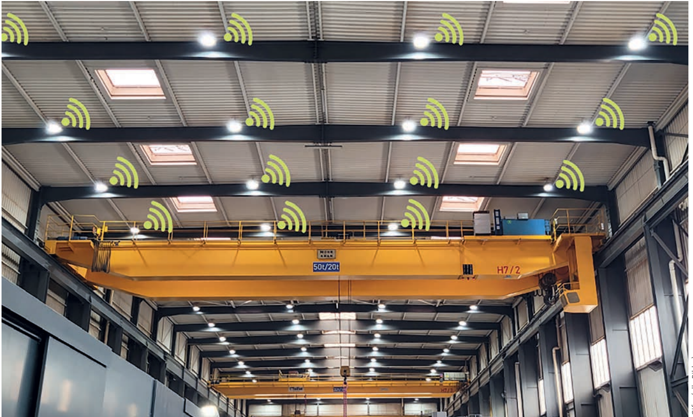
Gifras (alle Bilder)