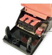
Steckklemmen (6-pol. EENNLL)