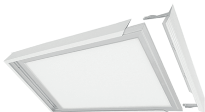
Aufbaurahmen aus Aluminium (weiß RAL9016)